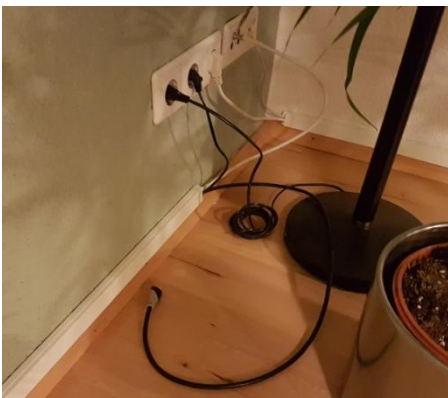
Im Eck befindet sich ein HDMI-Anschluss (TV HDMI 1):